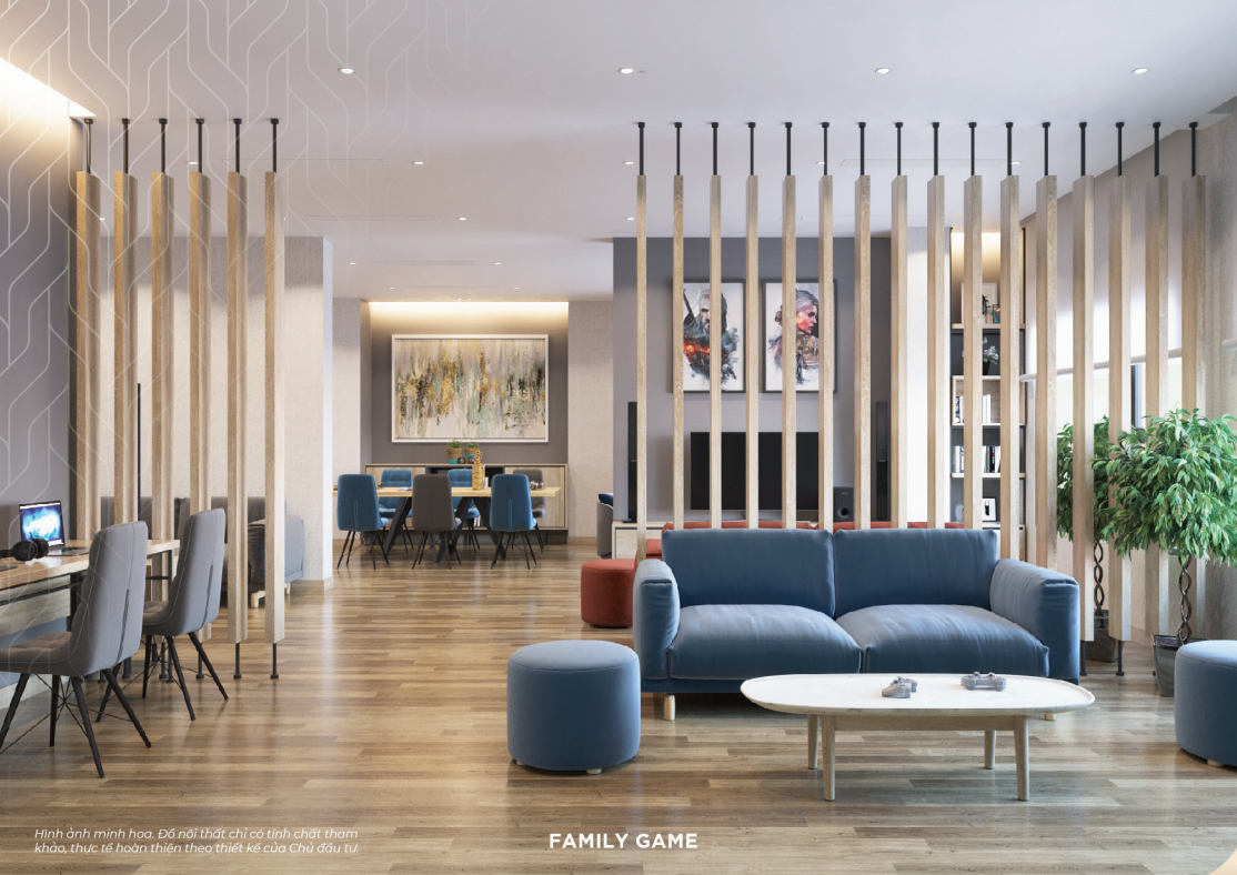
Hình ảnh minh họa. Đồ nội thất chỉ có tính chất tham khảo, thực tế hoàn thiện theo thiết kế của Chủ đầu tư.