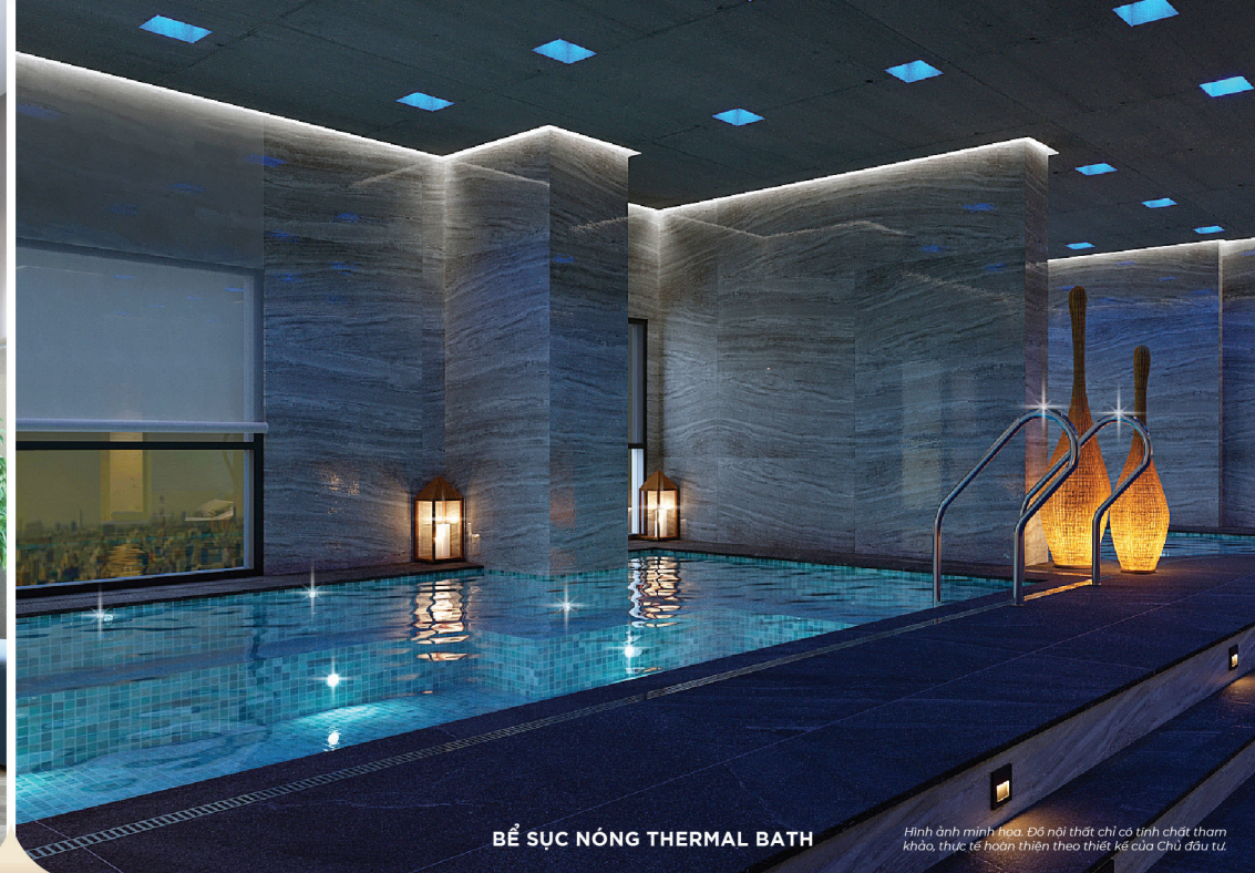
BỂ SỨC NÓNG THERMAL BATH