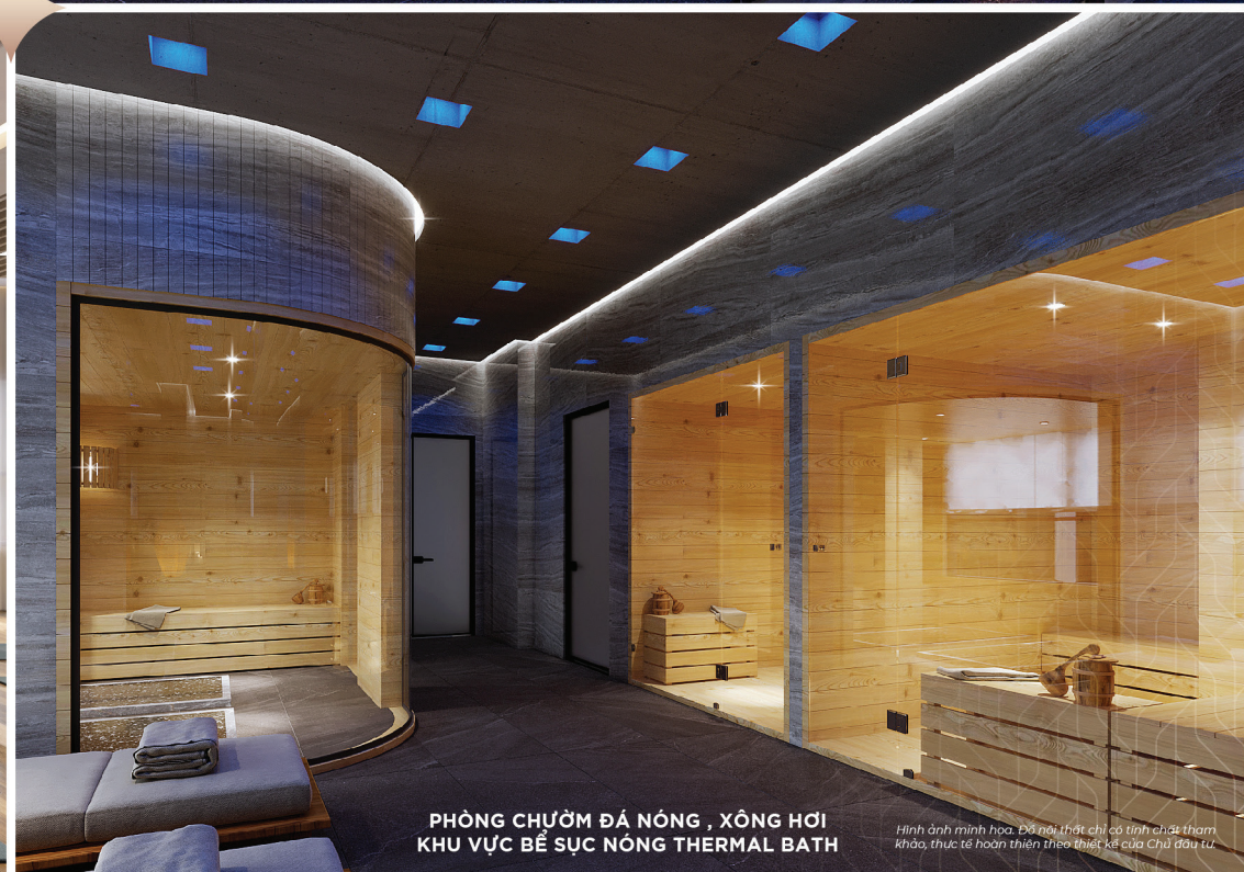
PHÒNG CHƯỜM ĐÁ NÓNG , XÔNG HƠI KHU VỰC BỂ SỨC NÓNG THERMAL BATH