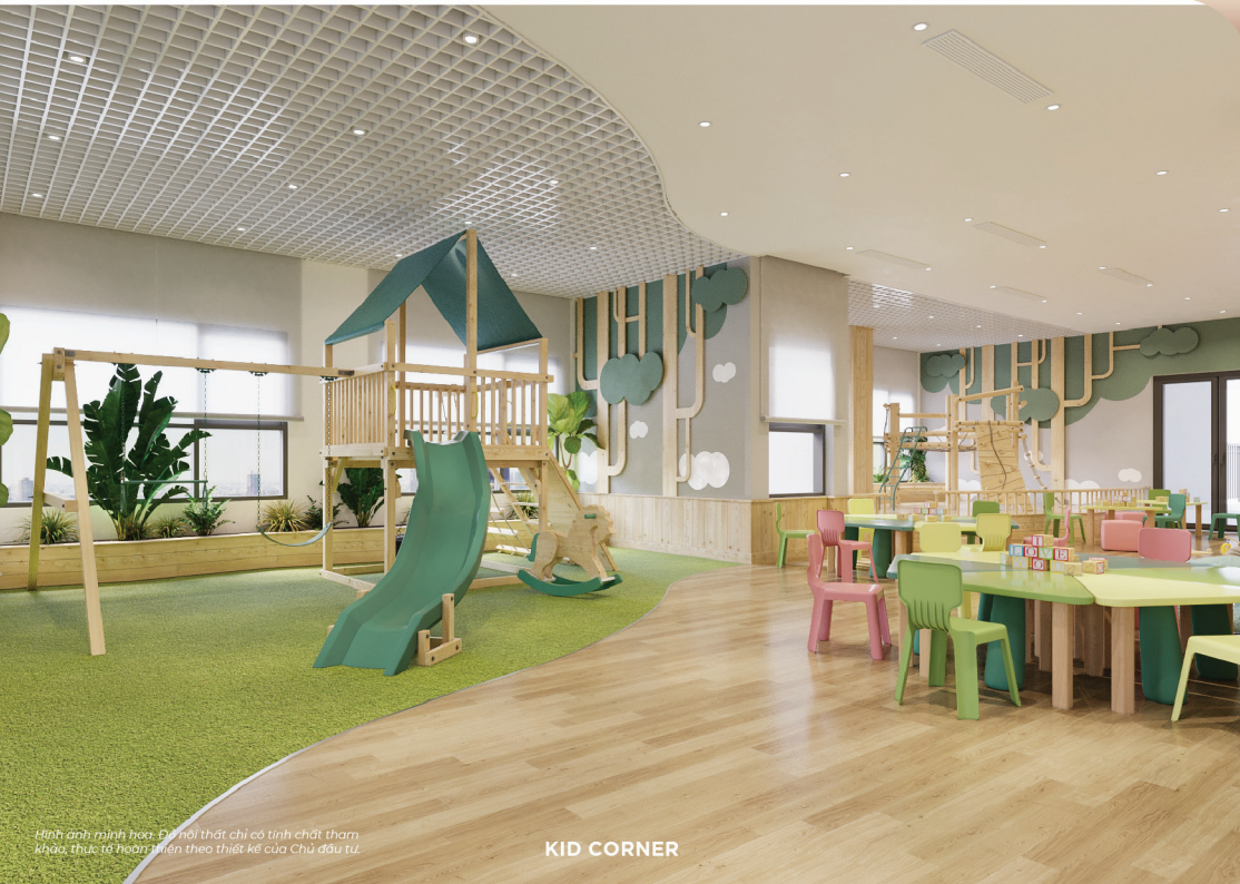
Hình ảnh minh họa. Đồ nội thất chỉ có tính chất tham khảo, thực tế hoàn thiện theo thiết kế của Chủ đầu tư.