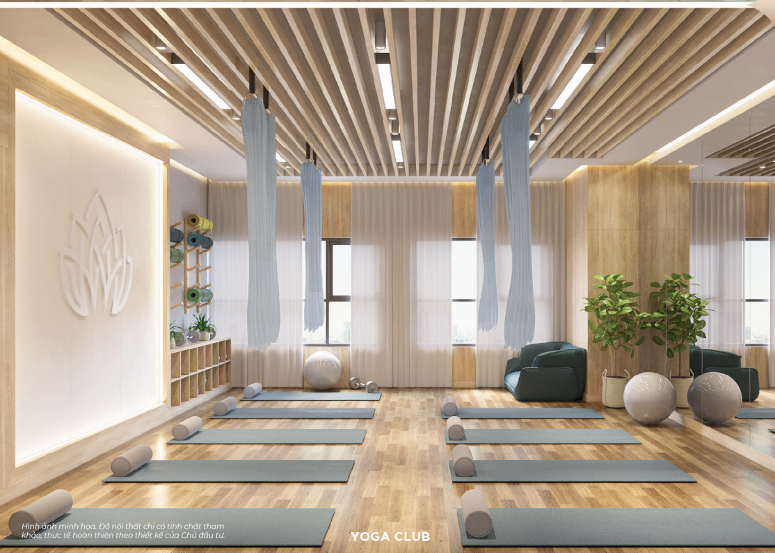
Hình ảnh minh họa. Đồ nội thất chỉ có tính chất tham khảo, thực tế hoàn thiện theo thiết kế của Chủ đầu tư.