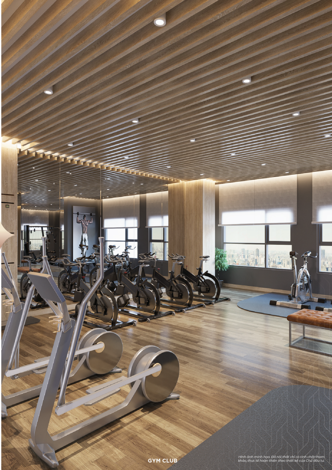
Hình ảnh minh họa. Đồ nội thất chỉ có tính chất tham khảo, thực tế hoàn thiện theo thiết kế của Chủ đầu tư.