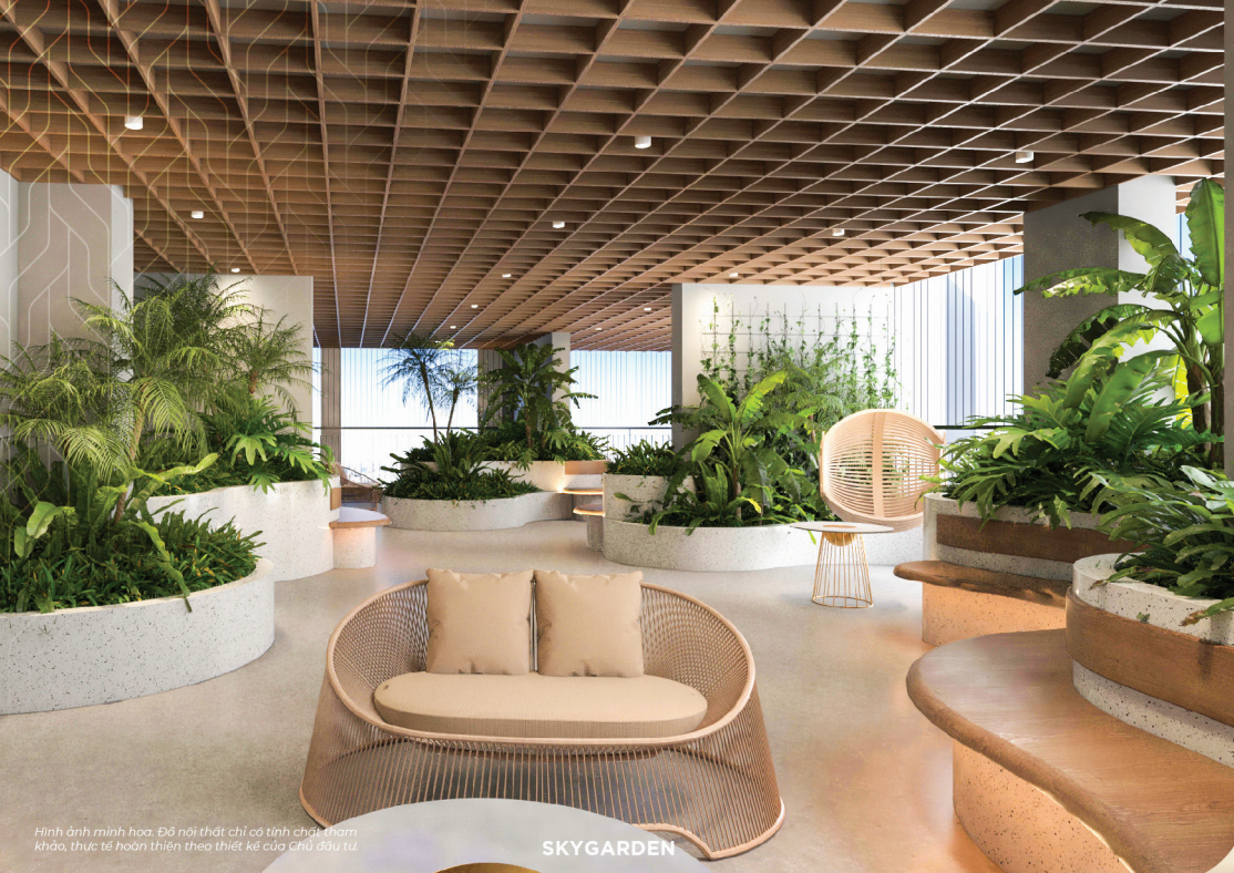
Hình ảnh minh họa. Đồ nội thất chỉ có tính chất tham khảo, thực tế hoàn thiện theo thiết kế của Chủ đầu tư.